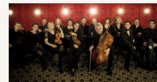
Musica Vitae från Växjö möter den turkiska blåsarvintetten Camerata Smyrna på Lammhults Möbel AB, som den 1 november förvandlas till konsertsal.