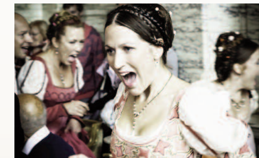
Romeo &amp; Juliakören