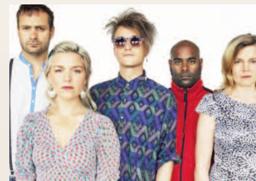
Svenska New Tide Orchestra kända för bl a "Searching for Sugarman" avslutar festivalen tillsammans med Brasilianska PianOrquestra på Olsbergs Arena i Eksjö.