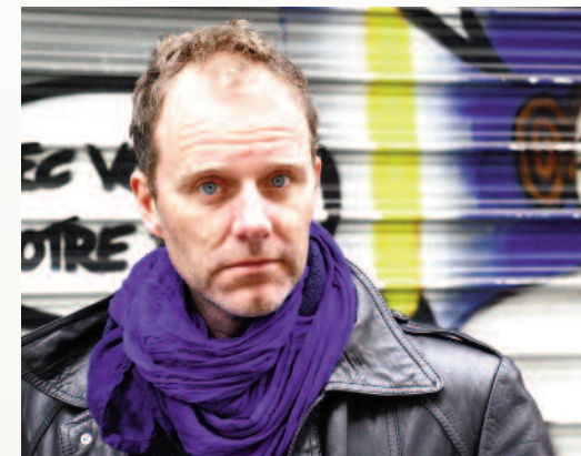
John Ajvide Lindqvist